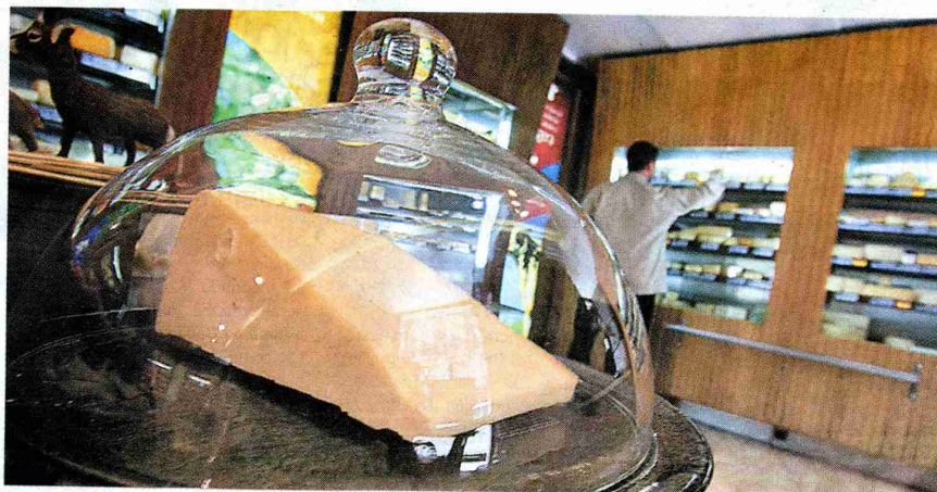
Quesera de la tienda de delicatessen Poncelet, en el centro de Madrid.

Oomuombo significa colmena en pigmeo. Un guiño de esta empresa sueca que produce y vende dulces, chucherías para adultos. El blanco nuclear casi ciego, dejando a la vista mil formas de colores, apoyadas en un diseño gráfico del