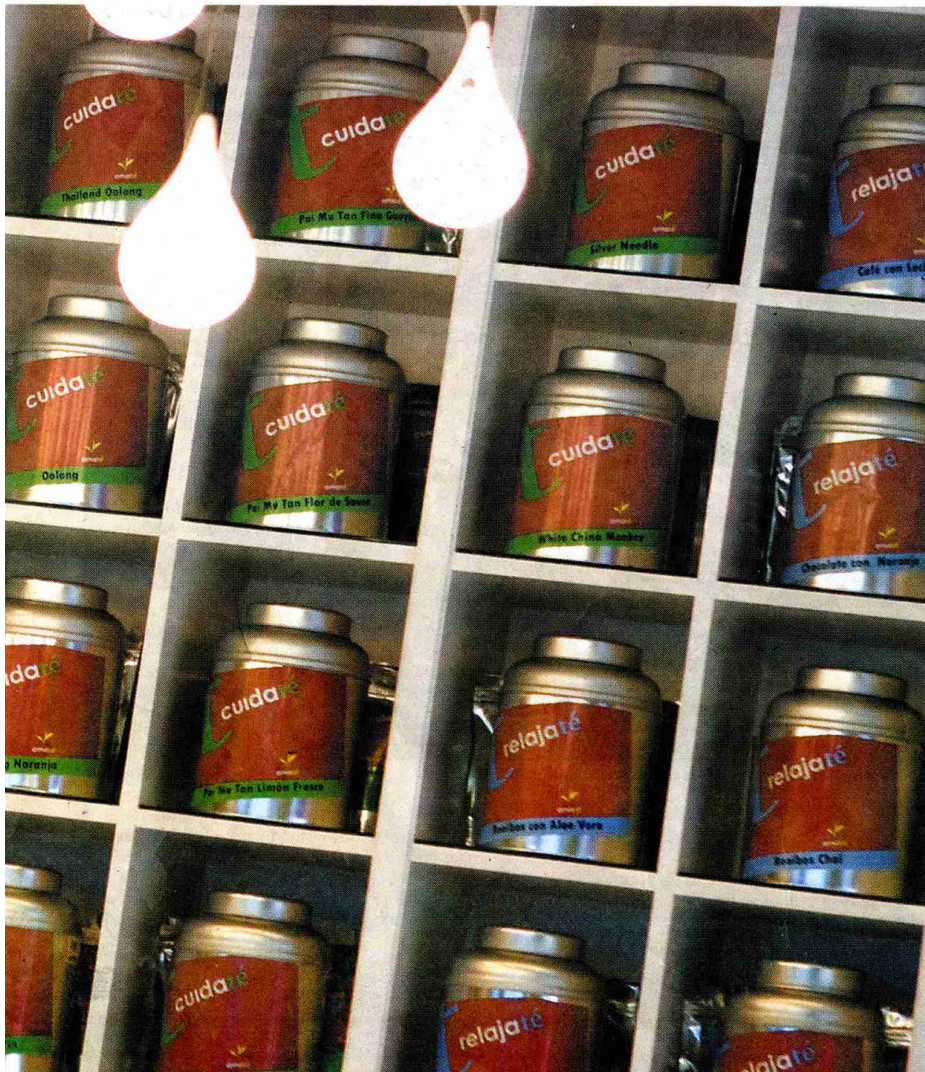
Estantería, con envases de té, en la tienda Amaté, en Madrid.

logotipo y la señalética colorista y de líneas puras, todo para mostrar las especialidades y las características de las golosinas, libres de grasas trans y no manipuladas genéticamente.